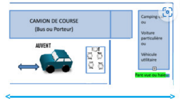
EXEMPLE IMPLANTATION 2